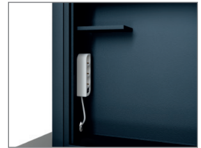
inkl. Mehrfachstecker und Ablage