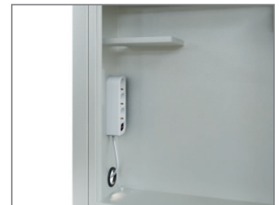
inkl. Mehrfachstecker und Ablage