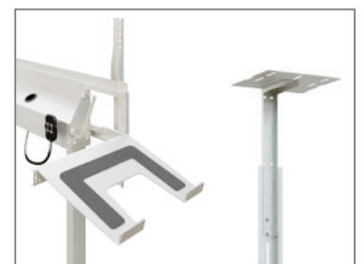
erweiterbar mit Laptop- / Kamera-Aufnahme