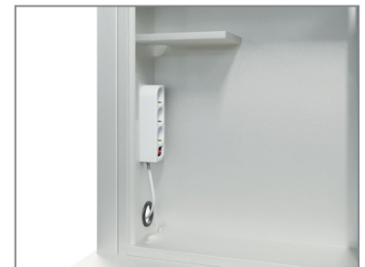
Medienschränk mit Mehrfachstecker und Ablage