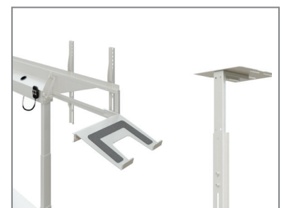
erweiterbar mit Laptop- / Kamera-Aufnahme